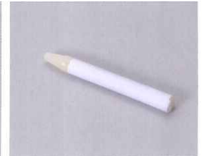
ジッパーの動きをスムーズにします