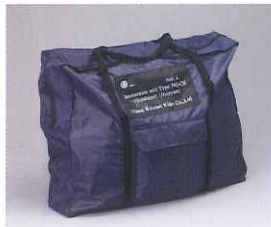
幅:560mm 高さ:470mm 奥行:160mm